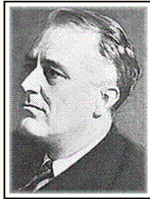
Franklin Delano Roosevelt

¿Volvemos un poco atrás?. Estábamos hablando de los amigos de Franklin. Muchos de ellos fueron los artífices de la asunción de quien fuera el segundo presidente de los Estados Unidos, John Quincy Adams , ocultista de cuño como que formaba parte de la llamada Sociedad de los Dragones . Miembros de esta sociedad fueron responsables del diseño urbanístico de la ciudad de Washington, en el cual se reconoce un indudable sello metafísico. Y a la misma sociedad perteneció Abraham Lincoln , confeso ocultista y espiritista, cuyo pensamiento siempre influyó —y no precisamente por sus ideales libertarios de la esclavitud— en otro presidente, grado 33 de la Masonería, llamado Franklin D. Roosevelt . Sí, el mismo que internacionalizó el concepto del " New Deal " en palabras y etapas en un todo identificables en las propuestas escritas por Los Iluminados de Baviera.